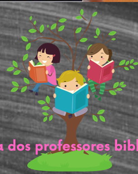
A Equipa dos professores bibliotecários