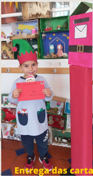
Entrega das cartas ao Pai Natal

As famílias colaboraram e empenharam-se e fizeram os trabalhos mais bonitos e únicos de sempre!