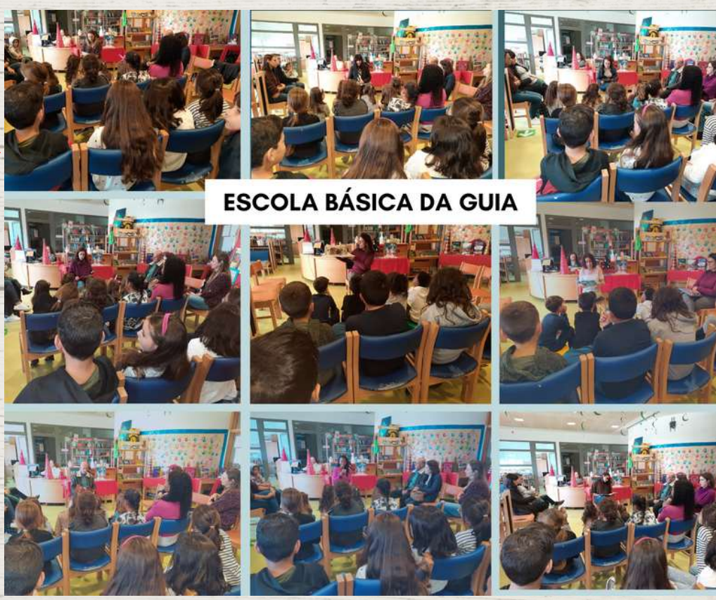
ESCOLA BÁSICA DA GUIA