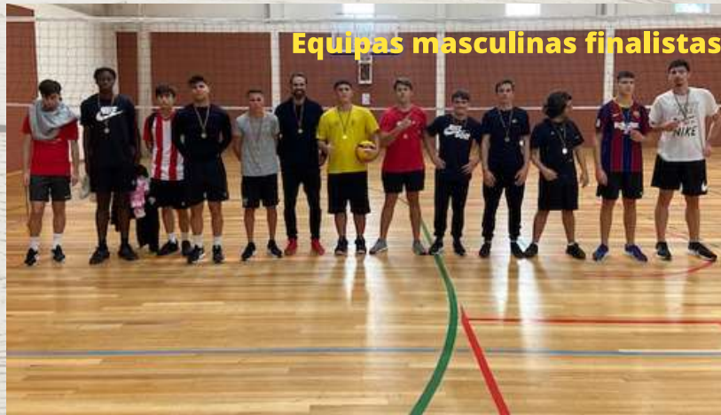
Equipas masculinas finalistas