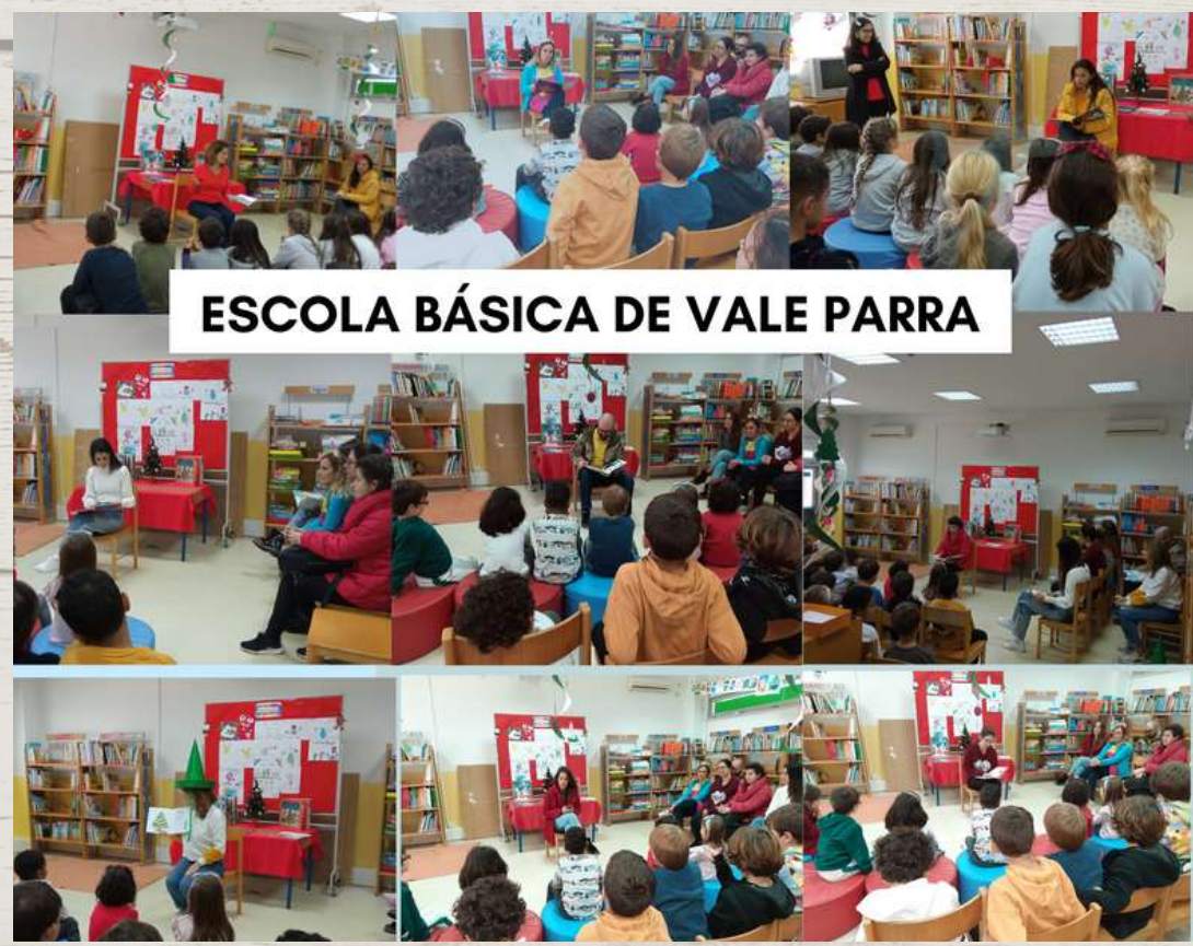
ESCOLA BÁSICA DE VALE PARRA