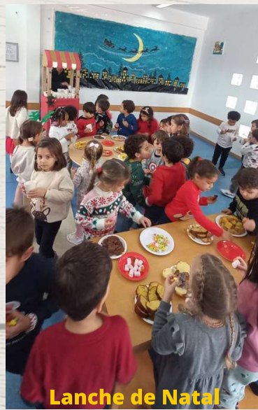
Lanche de Natal