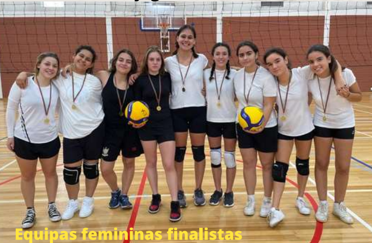
Equipas femininas finalistas

Na Escola Secundária teve também lugar no dia 15 de dezembro a já tradicional Maratona de Voleibol (4X4), com uma enorme participação de alunos e pavilhão cheio a assistir. Tivemos a participar 21 equipas masculinas num total de 106 jogadores, sendo vencedores os "Carbotulhas" e vencidos os "BestRizzers". No quadro feminino participaram 6 equipas envolvendo 31 jogadoras, venceram este torneio "Billy Jean" e em segundo lugar "Puffs".