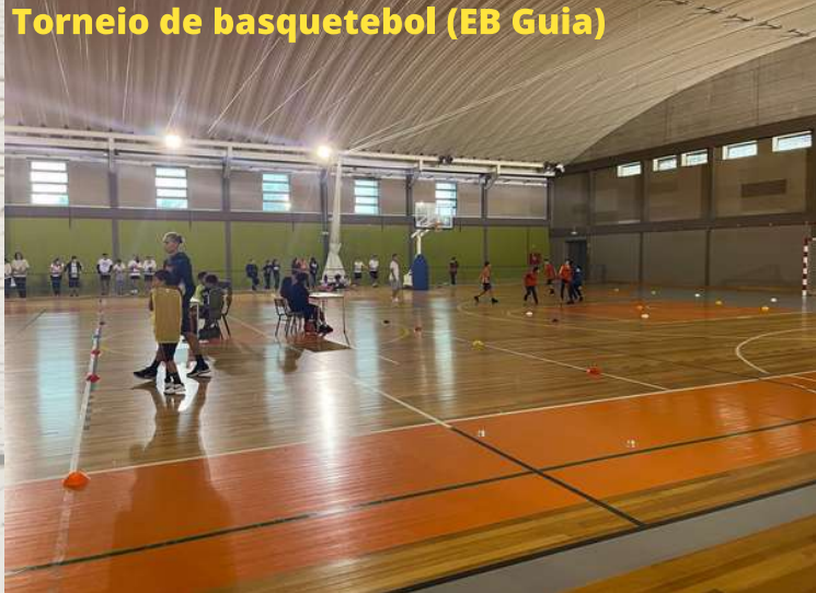
Torneio de basquetebol (EB Guia)

No âmbito da Atividade Interna do Desporto Escolar, no Agrupamento de Escolas de Albufeira Poente, realizou-se no dia 15 de dezembro o Torneio de Basquetebol 3x3 nas Escolas Básica da Guia e D. Martim Fernandes. Na Escola da Guia participaram 16 equipas dos vários escalões num total de 59 alunos, e na Escola D. Martim Fernandes participaram igualmente 16 equipas, num total de 64 alunos. As equipas vencedoras de cada um dos escalões irão representar o nosso Agrupamento na próxima Fase Regional do Torneio.