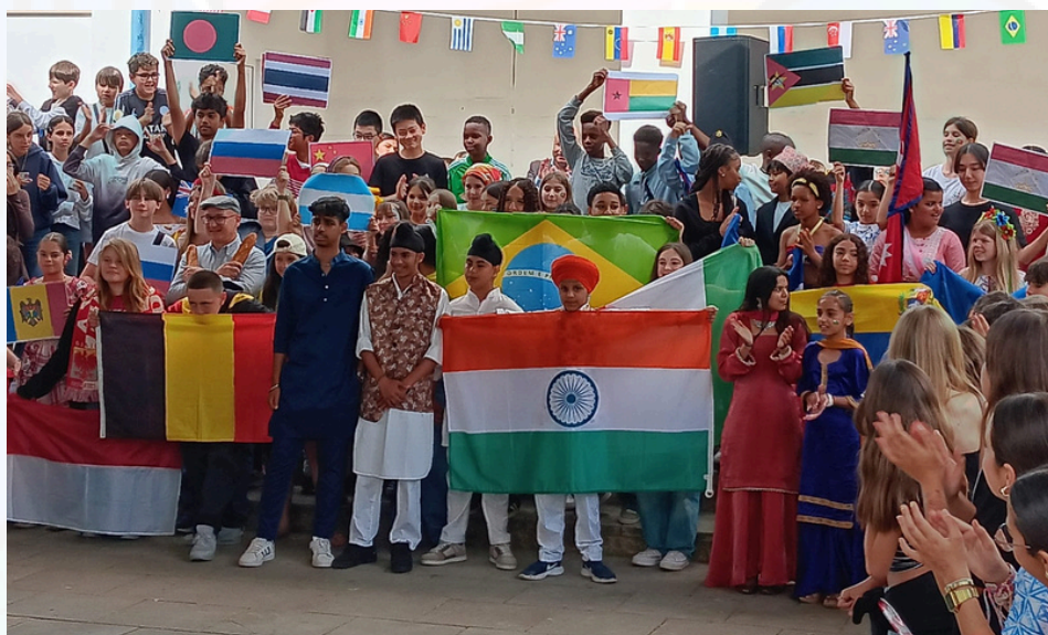
SEMANA DA INTERCULTURALIDADE