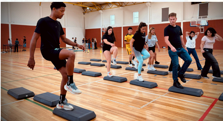
COM UM PÉ NO SECUNDÁRIO- O 9.º ANO NA ESA