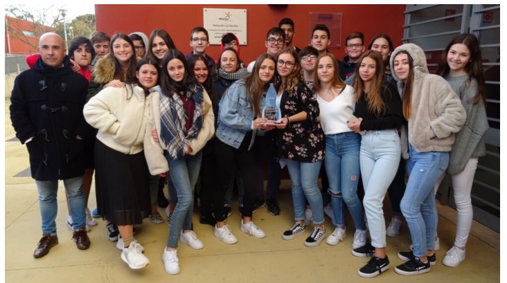
Turma da equipa vencedora, 9.º BG – EB. Guia